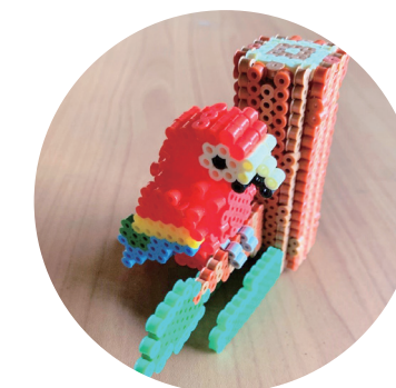
外来作業療法利用者作品 立体アイロンビーズ